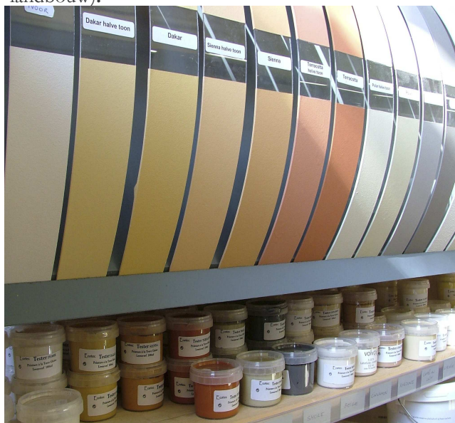
Tintelij, coöperatieve voor natuurverf en schilderwerken te Gent

Verder zijn andere coöperatieven in het duurzame werkveld o.a. De Natuurfrituur , Tintelij (natuurverven), Hinkelspel (productie van biologische kaas), De Wassende Maan (biodynamische landbouw).