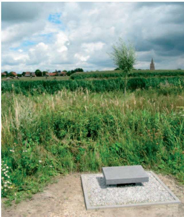
omzoomd met een meidoornhaag.

Na ruiling met een landbouwer bekam de gemeente een geschikt stuk grond voor de gedenkplaats. Een ontwerpplan van Buro Groen voor de inrichting ervan – opnieuw via het Interreg-IV subsidieproject - werd recent ook voorgelegd aan de milieuraad. Het wordt een natuurvriendelijke herdenkingsite : dolmen vanuit Wales met een Welshe draak te midden van knotwilgen en een panoramabord met zicht op de Steenbeekvallei en Passendale. Het geheel wordt