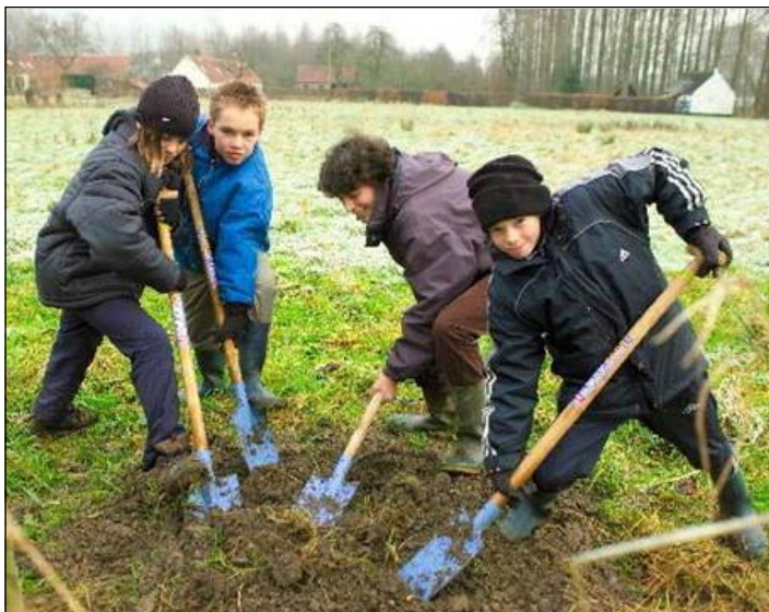
jongeren steken de handen uit de mouwen en planten een bos

In 2010 worden er opnieuw luchtfoto's genomen. We zullen tot dan moeten wachten om te zien hoeveel bos er effectief meer of minder is. Maar wiens handen jeuken om zelf aan de slag te gaan voor meer bos, kan op de Tandemwebsite www.tandemweb.be de fiche "plant een bos" downloaden (Projectendatabank > Eenvoudig zoeken > "bos" intikken).